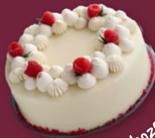
Fijne Frambozentaart met witte chocolade mousse