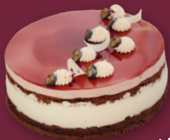
Cassis taart met krokante bodem